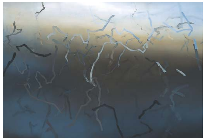
光の匂ひーみこもりVI 2004 キャンバスに油彩 162.2×227.2cm

「写真の断片を写して描くことで、キャンバスとの間に距離を保てるようになりました」